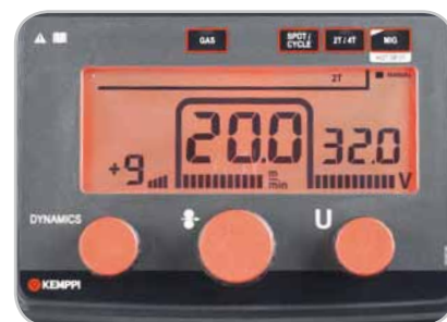
Interfaz del panel de control Kempact R

Las nuevas características de tecnología incluyen reducción de costos energéticos de más del 10% cuando se la compara con las fuentes de potencia controladas por escalas; iluminación Brights™ de la cabina para facilitar la carga del alambre en condiciones de poca iluminación; función de alerta del servicio WireLine™, que indica necesidad de mantenimiento de rutina de la alimentación de alambre; y el diseño integrado GasMate™ del chasis, que convierte la carga de los cilindros y los desplazamientos de la máquina en algo fácil y seguro. Sin importar el modelo que elija, Kempact RA le garantiza los máximos resultados en todas las tareas de soldadura..