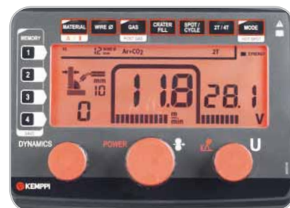
Interfaz del panel de control Kempact A

Para información detallada sobre el producto, videos y noticias visítenos en www.kemppti.com